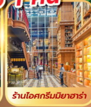
ร้านไอศกรีมมียาฮาร่า