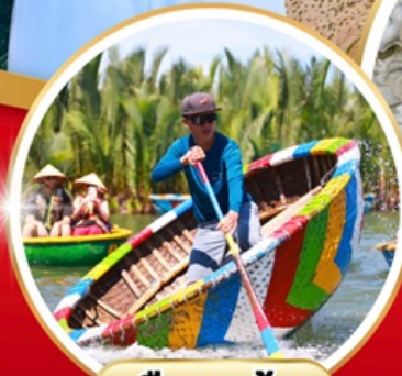
เรือกระด้าง