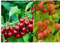
สวนผลไม้ตามฤดูกาล

** พักที่ Hunza Darbar Hotel หรือเทียบเท่า **