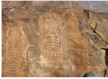
เมืองชิลาส

** พักที่ Shangrila Chilas Hotel หรือเทียบเท่า **