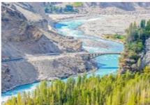
ป้อมปราการ Altit Fort

DAY4 ป้อมปราการอัลติท-ตลาดพื้นเมือง-ฮอปเปอร์ กลาเซียร์-หุบเขาคฺยเกอร์