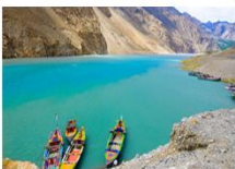
ทะเลสาบอิตตาบัต