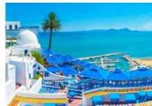
Sidi Bou Said

** พักที่ Continental Hotel 5* หรือเทียบเท่า **