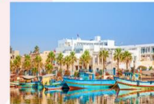
เมืองฮัมมาเมต

** พักที่ Radisson Blu Hammamet Hotel 5* หรือเทียบเท่า **