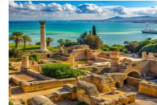
เมืองคาร์เจจ

17.15 น. ออกเดินทางสู่อิสตันบูล ประเทศตุรกี เที่ยวบิน TK664 22.10 น. เดินทางถึงสนามบินอิสตันบูล และเปลี่ยนเครื่อง