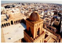
สุเหร่าซิติ อักบาร์