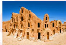
เมืองโทรเซอร์

** พักที่ Tui Magic Hotel Palm Beach Palace 5* หรือเทียบเท่า **