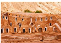
บ้านหลุมโทรโกลไคท์