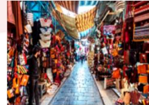
Tunis Old Medina