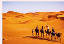
ทะเลทรายซาฮารา

** พักที่ Sahara Hotel 4* หรือเทียบเท่า **