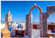
พิพิธภัณฑ์บาร์โด