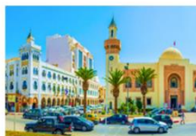
เมืองสแฟกซ์

** พักที่ Radisson Hotel Sfax 5* หรือเทียบเท่า **