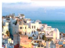
เมืองแทนเจอร์

** พักที่ Riad Cherifa Hotel 4* หรือเทียบเท่า **