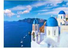
เกาะซานโตรินี่

** พักที่ Aelia Suites Karterados Hotel 4* หรือเทียบเท่า **