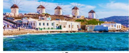
เกาะมิโคนอส

** พักที่ Camarades Hotel 4* หรือเทียบเท่า **