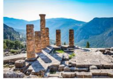
วิหารเทอพอลโล

** พักที่ Divani Meteora Hotel 4* หรือเทียบเท่า **