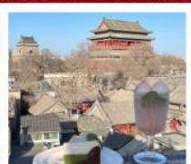
คาเฟ่ชาตาคา

หอประชุมเทียนถาน • จัตุรัสเทียนอันเหมิน • พระราชวังโบราณปักกิ่ง • ถนนหวังฝูจิ้ง 798 Art District • พิพิธภัณฑ์ภาพยนตร์จีน • คาเฟ่กาแฟบ้านน้ำตาค พระราชวังฤดูร้อนอวี่เหอหยวน • กำแพงเมืองจีนด้านจวิหยกวง ZHONGHAI DAJI • วัดลามะ • ย่านชานหฺลี่ถุน (POP MART) • ถนนคนเดินที่กู่หลี่