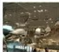
เมืองโบราณอูเจิ้น