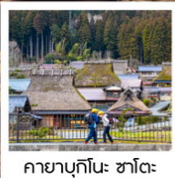
คายาบุกิโนะ: ซาโตะ