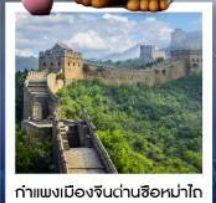
กำแพงเมืองจีนด่านซือหม่าไท่

เมืองโบราณกุ่เป่ย์สู่ยจิ้น / กำแพงเมืองจีนด่านซือหม่าไท่ (รวมค่ากระเช้าขึ้น-ลง) / ชมวิวกำแพงเมืองจีนและเมืองโบราณ ยูนิเวอร์แซลปักกิ่ง (รวมค่าบัตรเข้า) / จัตุรัสเทียนอันเหมิน / พระราชวังโบราณกู้กง / หอบูชาเทียนถาน คาเฟ่กาแฟบ้านน้ำตาล (TANG FANG CAFE) / พระราชวังฤดูร้อนอวิ๋เหอหยวน / ย่านชานหลี่ถุน (POP MART) / ถนนคนเดินไท่กู่หลี่