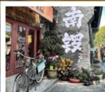
ถนนโบราณหนานหลิวกู่เซียง