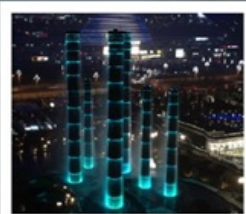
ห้างสรรพสินค้า SKP