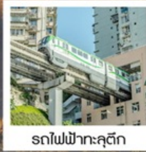
รถไฟฟ้าคุตึก