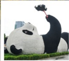
รูปปั้นแพนด้าเซลฟี่