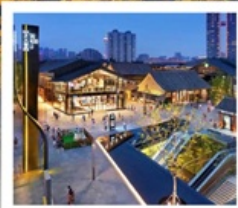
ถนนคนเดินไท่กู่หฺลี่