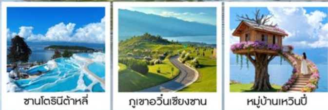
ซานโตรินี่ต้าหลี่

“เกาะเสี้ยวผู่...เกาะลึกลับกลางทะเลสาบ เอ้อไห้”