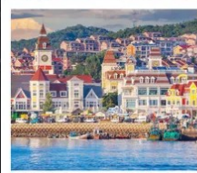
ท่าเรือประมงเหียนโก๋