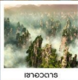
เซาอวตาร