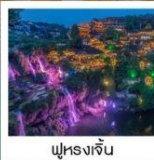
ฟูหรงเจิน