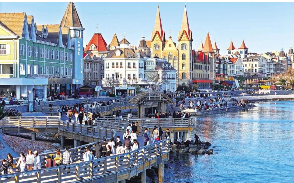
ริมหาดแห่งนี้

นำท่านเดินทางสู่แลนด์มาร์คยอดนิยมของเมืองเยียนโก ณ ท่าเรือชาวประมง แหล่งท่องเที่ยวริมทะเลที่โดดเด่นด้วยสถาปัตยกรรมสไตล์ยุโรป สีสดใส ให้ความบรรยากาศโรแมนติกคล้ายเมืองชายฝั่งในยุโรป ภายในพื้นที่รายล้อมไปด้วยร้านค้า คาเฟ่ และร้านอาหารทะเลสดใหม่ ให้ท่านได้เดินเล่นพักผ่อน พร้อมเพลิดเพลินกับวิวทะเลและอากาศบริสุทธิ์ อีกทั้งยังมีมุมถ่ายรูปสวยๆ มากมาย ไม่ว่าจะเป็นอาคารหลากสี ท่าเรือ หรือฉากหลังเป็นทะเลกว้างสุดสายตา อีสาระให้ท่านเก็บภาพความประทับใจ และสัมผัสเสน่ห์ของเมืองท่า