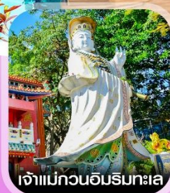
เจ้าแม่กวนอิมรมทะเล