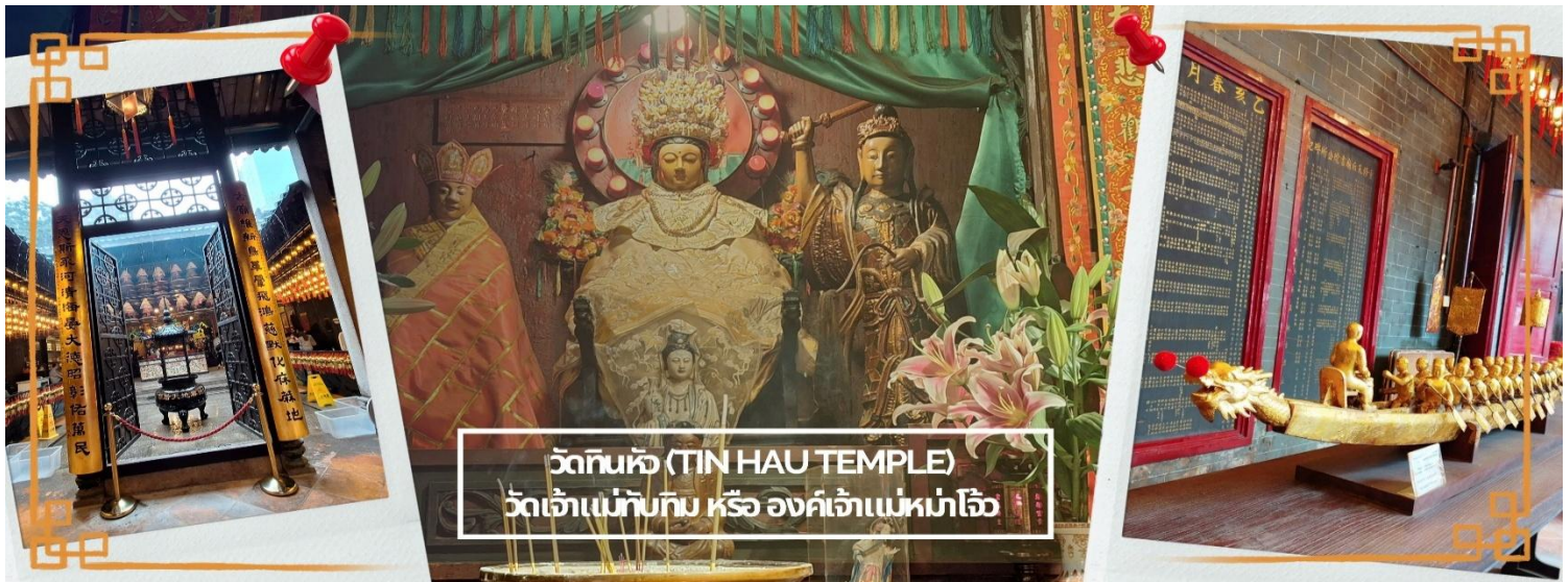
วัดทินหัว (TIN HAU TEMPLE) วัดเจ้าแม่ทับทิม หรือ องค์เจ้าแม่หม่าโจ้ว

จากนั้นนำท่าน ไหว้ขอพรเรื่องเดินทาง การติดต่อ ค้าขาย วัดเจ้าแม่ทับทิมทินหัว (Tin Hau Temple) ที่ Yau Ma Tei เป็นวัดเก่าแก่ขนาดเล็ก อายุกว่า 150 ปี มีต้นกำเนิดมาจากวัดเล็กๆ ใน พื้นที่ตลาด Kwun Chung เคยเป็นหมู่บ้านชาวประมงมาก่อน ตั้งแต่ปี 1864 เป็นวัดที่อุทิศให้กับทินโหว่ (หมาจิ้งจอก เทพเจ้าแห่งท้องทะเล) มีบรรยากาศที่สงบ ร่มรื่น ติดกับสวนสาธารณะเล็ก ๆ และนักท่องเที่ยวยังไม่พลุกพล่านมากจุดเด่นที่แนะนำคือ การปิดทองเรือมังกร เพื่อการงานการค้า ธุรกิจ ให้เจริญรุ่งเรือง