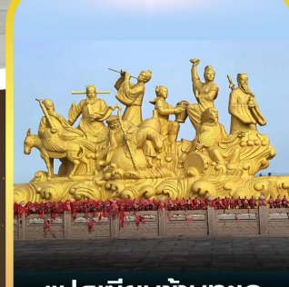
แปดเซียนข้ามทะเล