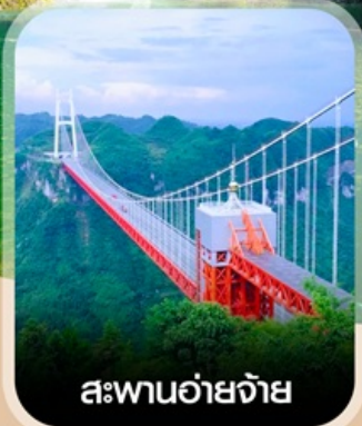
สะพานอ้ายจ้าย