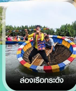
ล่องเรือกระดิ่ง

คอนเฟิร์มออกเดินทาง ทุกพีเรียด 2 ท่านขึ้นไป