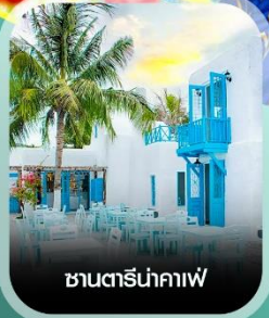
ซานตริ่นาคาฟ