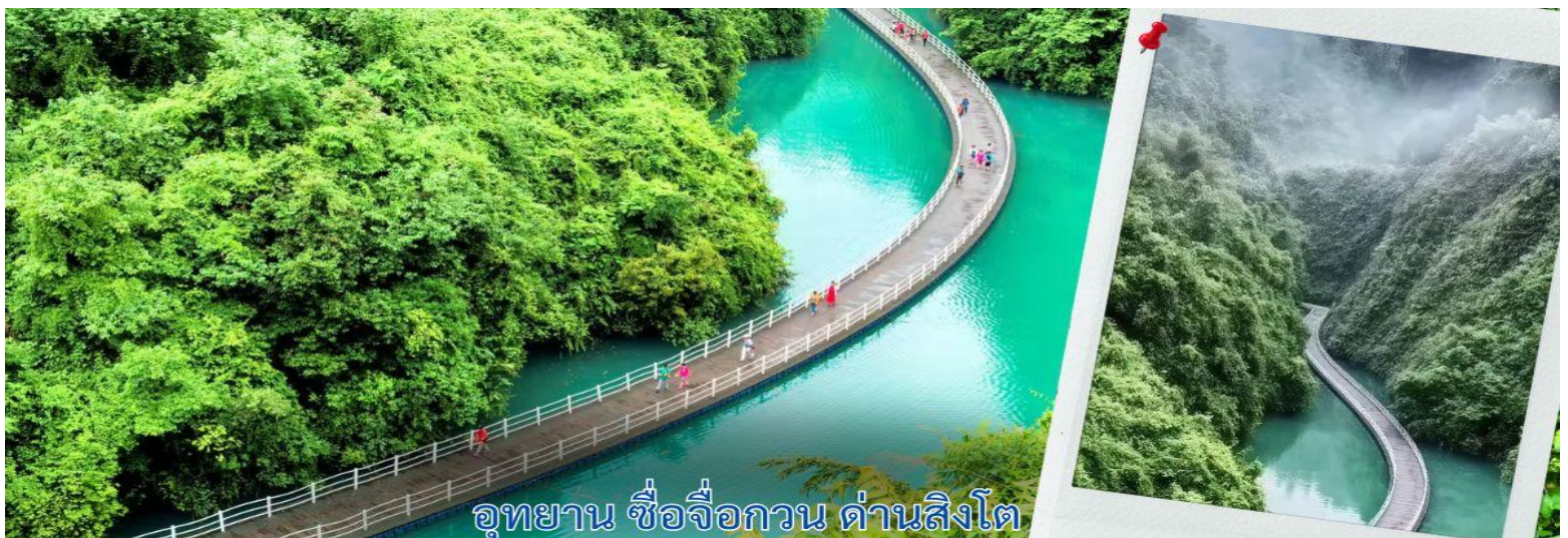
อุทยาน ซี้อจื่อกวาน ด่านสิงโต

หลังรับประทานอาหารเช้า นำท่านเดินทางสู่ อุทยานซี้อจื่อกวาน ด่านสิงโต อุทยานซี้อจื่อกวาน หรือที่คนท้องถิ่นเรียกว่า “ด่านสิงโต” เป็นพื้นที่ธรรมชาติที่เต็มไปด้วยภูเขาสลับซับซ้อน แม่น้ำสีฟ้าอมเขียว และอากาศบริสุทธิ์สุด จุดเด่นที่สุดของอุทยานแห่งนี้คือ สะพานลอยน้ำ สะพานลอยน้ำที่ทอดยาวกว่า 400 เมตร พาดผ่านกลางหุบเขาเหนือผืนน้ำสีเขียวใส สะพานนี้ถือเป็นหนึ่งใน สะพานลอยน้ำที่ยาวและสวยที่สุดในจีน รถอุทยานสามารถวิ่งข้ามสะพานได้ ตอนเล่นผ่านคือทั้งตื่นเต้นและประทับใจมาก เพราะวิวรอบตัวคือภูเขาเขียวขจีและผืนน้ำที่สะท้อนท้องฟ้าอย่างสวยงาม