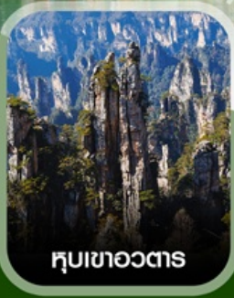
hubเขาอวตาร

ฟรี ใสชดชนแพ่ทอองกัน บับตรงลงจางเจียเจีย