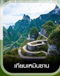
เทียนเหมินชาน

✈️ คอนเฟิร์มออกเดินทาง ทุกพีเรียด 2 ท่านขึ้นไป ✈️