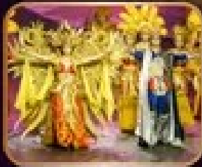
การแสดงโขนจีน-การตา