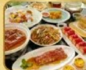
อาหารจีน 6 อย่าง