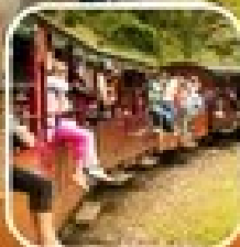
รถไฟหัวกระสุนไปเมลเบิร์น