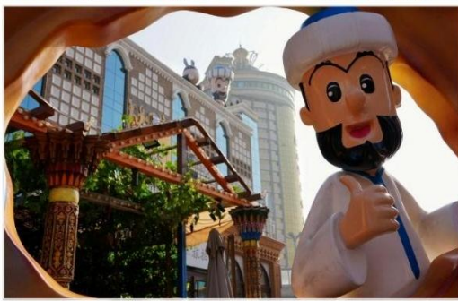
ตลาดนานาชาติซินเจียงแกรนด์บาร์ซาร์