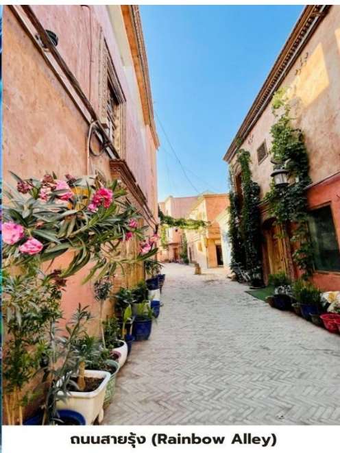
ถนนสายรุ้ง (Rainbow Alley)