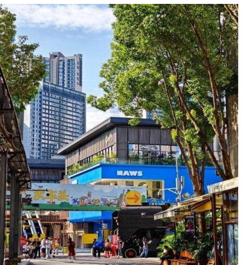
ตงเจียวจี้ (Eastern Suburb Memory)