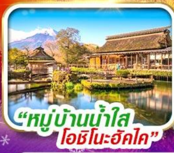
“หมู่บ้านน้ำใส โอชิโนะฮักไก”