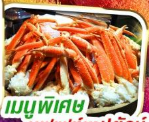
เมนูพิเศษ บุฟเฟต์ขาปูยักษ์

ราคาเพียง 35,999 *รวมภาษีมูลค่าเพิ่มแล้ว*