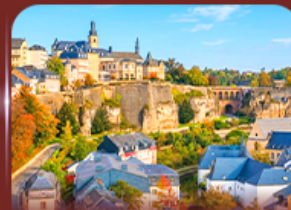
ย่านเมืองเก่า ลักเซมเบิร์ก