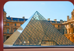
เซ็งอินพีพริกทินท์ลูฟวร์ ปารีส