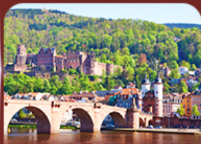
ชมเมืองสวย ไฮเดลเบิร์ก