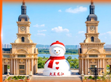
ตึกตาสหิมะยักซ์ ฮาร์บิน