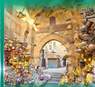
ตลาดผ่านเวลาคลีลี