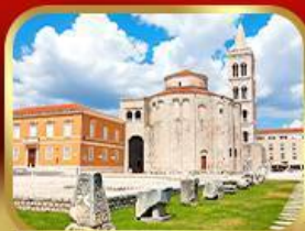
โบสถ์เซนต์โตนก ซาการ์