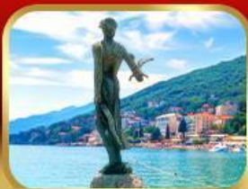
ราชินีแห่งอาเดรียติก โอฟาเทีย