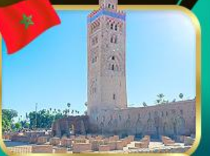
มัสยิดคูตูเบีย มาราเกช