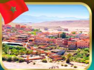
เมืองไอก์ เบนฮัดดู