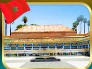
พระราชวังบาเฮีย