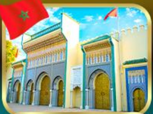
ประตูพระราชวังหลวง