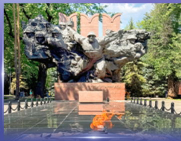
สวนสาธารณะ 28 Panfilov Park