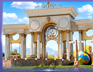
สวนสาธารณะประธานาธิบดี