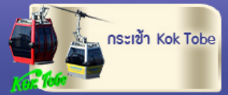
กระเชอ้า Kok Tobe