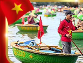
เรือกระด้ง หมู่บ้านกัมทาน