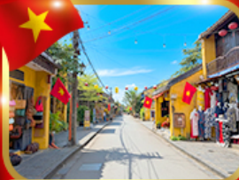
เมืองมรดกโลก ฮอยอัน