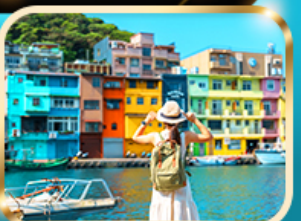
หมู่บ้านประมงเจิ้งปิ่น