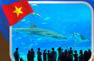
The Sea Shell Aquarium