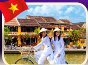
เข็คอินเมืองเก่าฮอยอัน