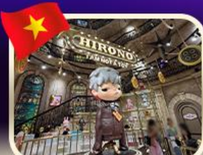
POPMART บานาฮิลล์