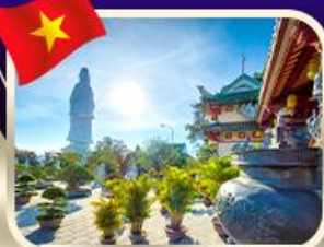
ชอพรทวนอิมวัดหลินอึ้ง