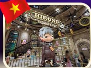
POPMART บานาฮิลล์