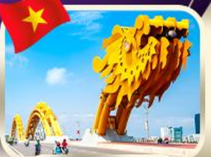
สะพานมังกร ดานัง