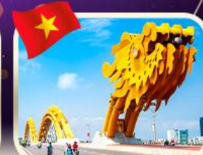
สะพานมังกร ดานัง