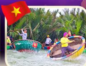
ล่องเรือกระด้งกิมทาน