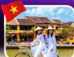
เชคอินเมืองเก่าฮอยอัน