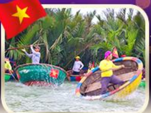
ล่องเรือกระด้งกัมทาน