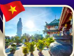
ชมพระกวนอิมวัดหลันอึ้ง