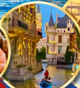
เมืองน้ำเวนิส