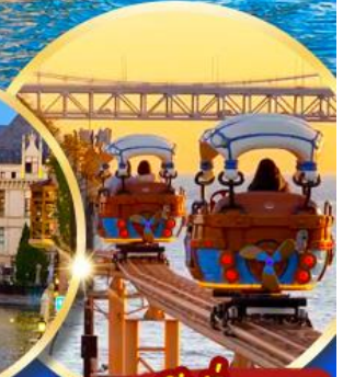
แถมฟรี! นั่งรถราง