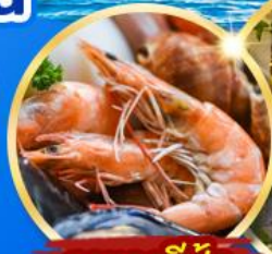
อาหารซีฟู้ด