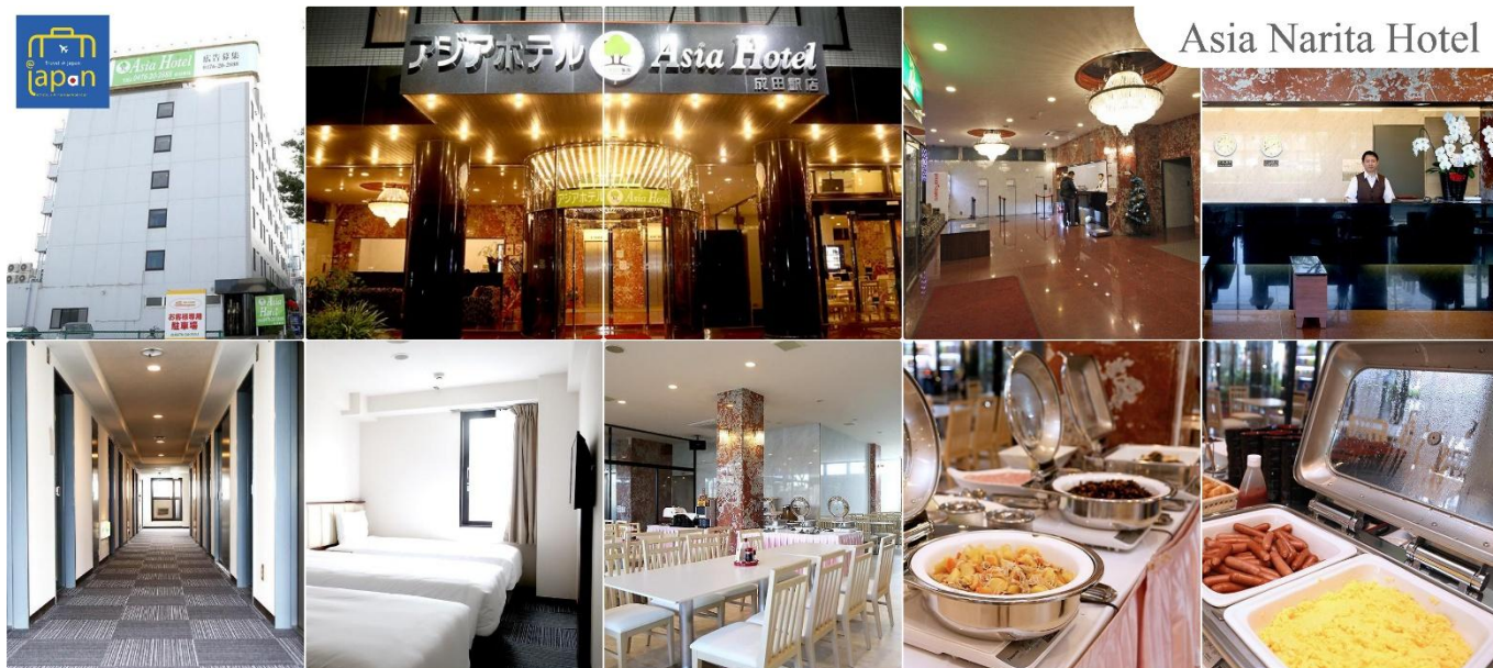
Asia Narita Hotel

พักที่ ASIA HOTEL NARITA หรือเทียบเท่าระดับเดียวกัน