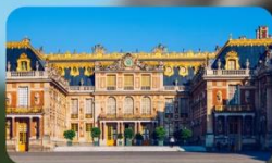
เข้าชมพระราชวังแวร์ซาย