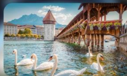
สะพานไม้ซาเปล