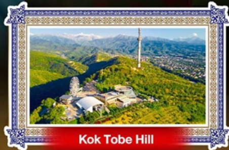
Kok Tobe Hill