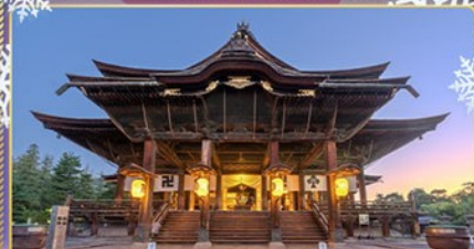
วัดเซ็นโคจิ นากาโนะ