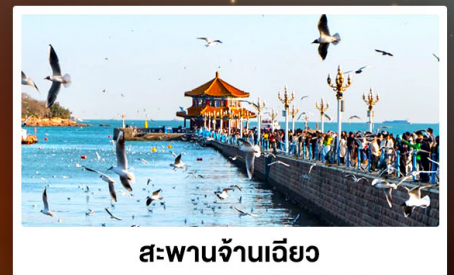
สะพานจ้านเฉียว