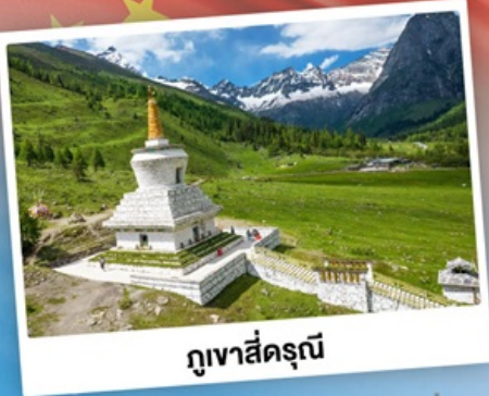
กุเวาสีครุณี

เที่ยว 2 อุทยาน กุเวาสีครุณี & ปี้ฝิงโกว เดินชมหมีแพนด้าสุดน่ารัก ใกล้ชิดกับแพนด้าแดง