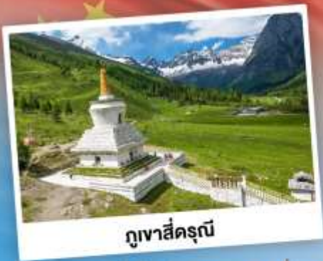
กู๋เจาสื่อตรุณี

เที่ยว 2 อุทยาน กู๋เจาสื่อตรุณี & ปี้ฝิงโกว เดินชมหมีแพนด้าสุดน่ารัก ใกล้ชิดกับแพนด้าแดง