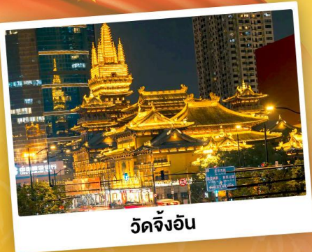
วัดจิ่งอัน