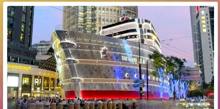
เรือหลุยส์วิตตอง