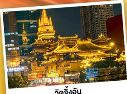
วัดจิ้งอัน