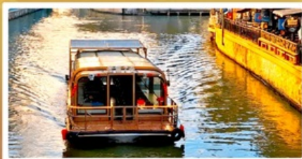
ล่องเรือ Grand Canal