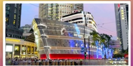
เรือหลุยส์วิตตอง